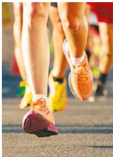
Etapa acontece no próximo dia 19

No Rio Grande do Sul, as Corridas Unimed já aconteceram em Santana do Livramento, Panambi, Montenegro, Bagé, Cruz Alta e Ijuí. Ao todo, 11 cidades sediarão a competição saudável.