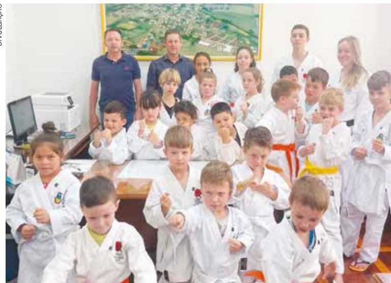
Jovens campinenses recebem novas vestimentas

“A entrega dos novos quimonos é um marco importante no apoio ao esporte em Campinas do Sul e demonstra o compromisso da administração em fortalecer as atividades esportivas locais. Com essa iniciativa, a cidade reforça seu compro-