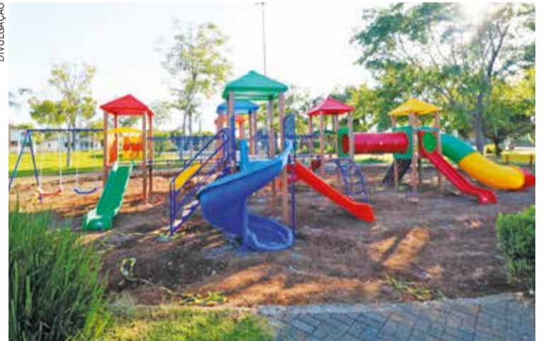
Praça Abel Onetta, em Áurea

A instalação dos novos brinquedos na Praça Abel Onetta foi concluída com sucesso. A prefeitura de Áurea ressalta que a praça agora conta com câmeras de segurança que monitoram o local 24 horas por dia, visando a prevenção de vandalismo. A administração municipal se compromete em garantir a segurança de todos os usuários.