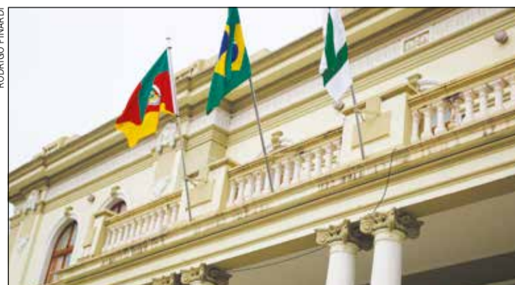
Faltam 11 meses para as eleições municipais de 2024, e o tempo está passando rápido