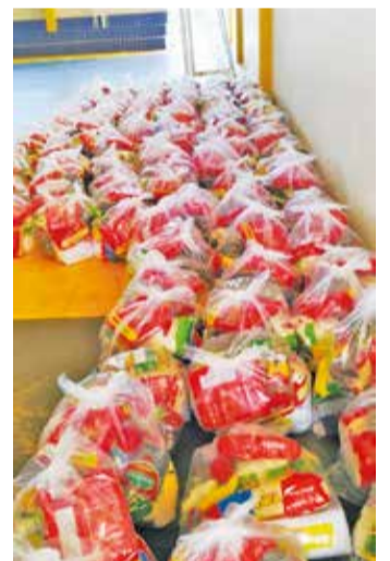
O município decretou situação de emergência em fevereiro deste ano, devido a estiagem que atingiu a região

Terça-feira (14/11): Saltinho - 9h às 09h40min; Pitanga Alta - 10h10min às 10h45min; Derrubadas - 08h30min às 09h15min; Povoado Moacir - 09h40min às 10h20min; Campo do Açoita - 10h40min às 11h10min; Povoado Racaloski e Anta Braba - 14h00 às 14h30min; Ginásio Municipal (Linha Picoli, Abissinia, Grazioli, Usina Douradinho, Linha Sbardeloto e Atalho do Racaloski) - 14h às 15h.